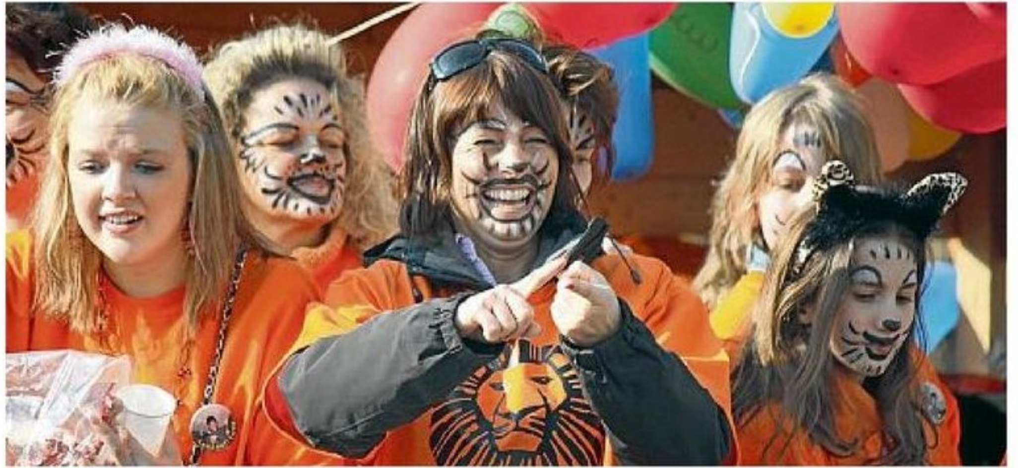
In Allach und im Würmtal finden traditionell Faschingsumzüge statt, in Neuhausen, am Westkreuz und in Pasing wird ein kunterbunter Straßenfasching mit vielen kostenlosen Angeboten und Attraktionen für jung und alt auf die Beine gestellt.

Jetzt geht's rund im Münchner Westen: Bis zum Faschingdienstag übernehmen die Närinnen und Narren die Macht und feiern in Vereinen, Pfarreien, Gaststätten und natürlich auf Straßen und Plätzen. Alle Veranstaltungen hier aufzuzählen, würde den Rahmen sprengen, deshalb konzentrieren wir uns zum Endspurt auf die großen Straßenfaschingsfeste für alt und jung: